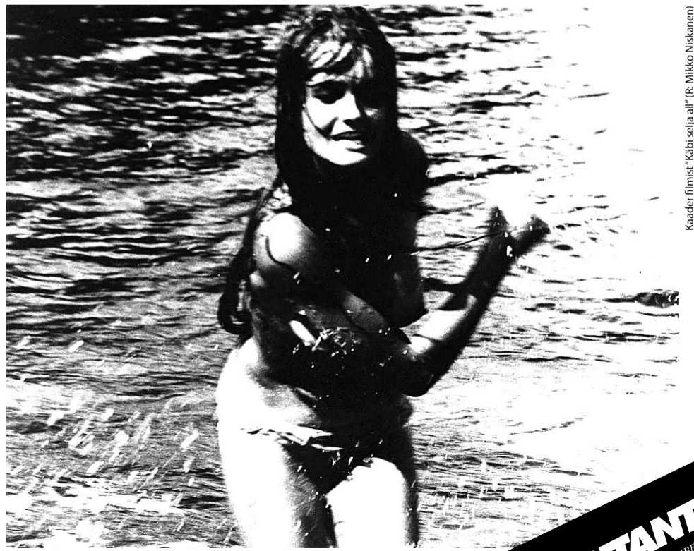
Kaader filmist "Käbi selja all" (E. Mikko Niskanen)

MUTANT DISCO 19. NOVEMBER – KINO SÖBERUS LESLIE DA BASS LIVE! LEO-YOUNG ZARZAMU RYTHM DIRECTOR RAE & SAREMBETS SIBA RESTOR