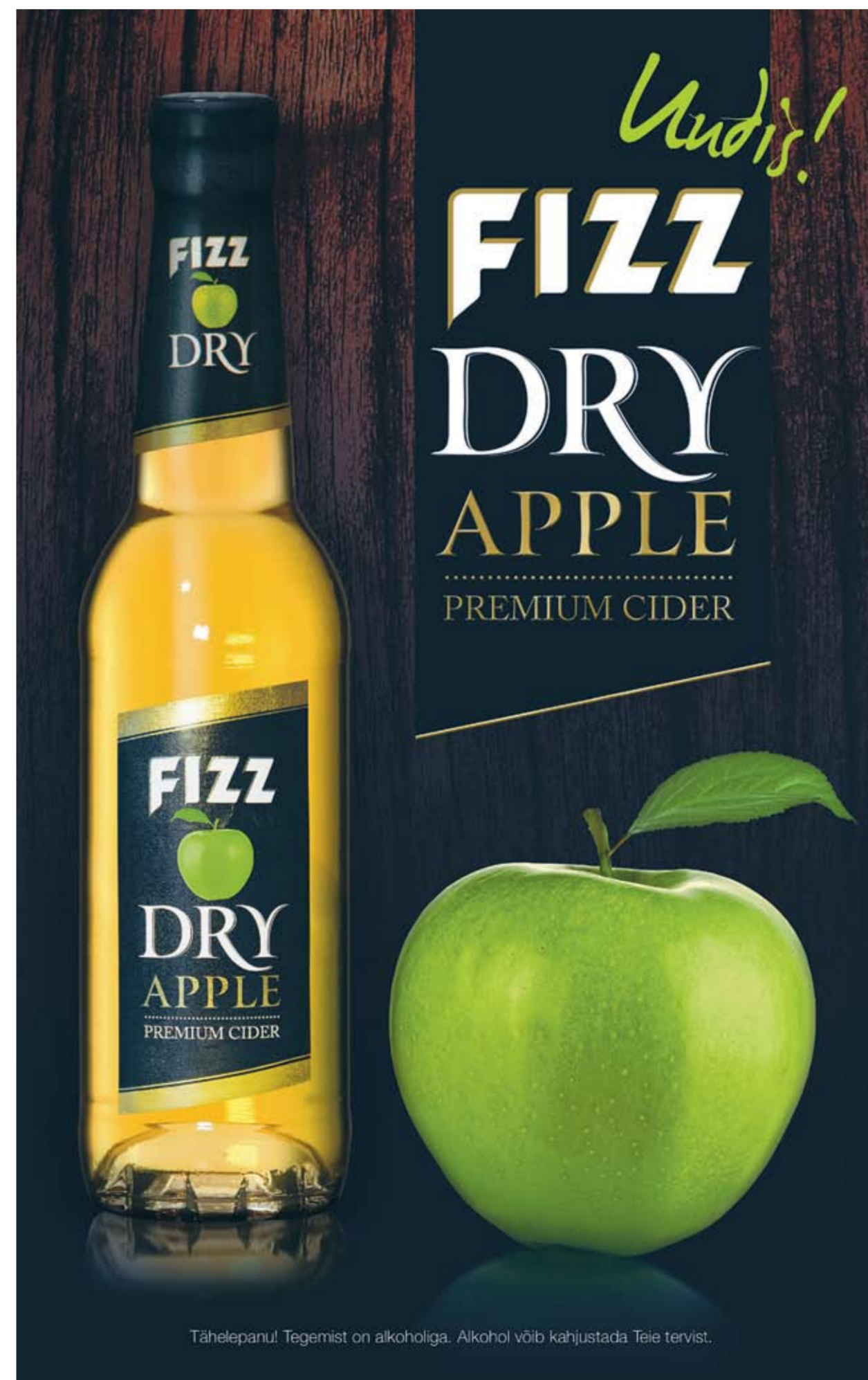
Tähelepanu! Tegemist on alkohooliga. Alkohool võib kahjustada Teie tervist.

MUTANT DISCO 19. NOVEMBER – KINO SÕPRUS LESLIE DA BASS LIVE! LEO-YOUNG ZAKARI RYAN THYNE DOCTOR RAE & SCARBOROUGH SIBB RESTOR