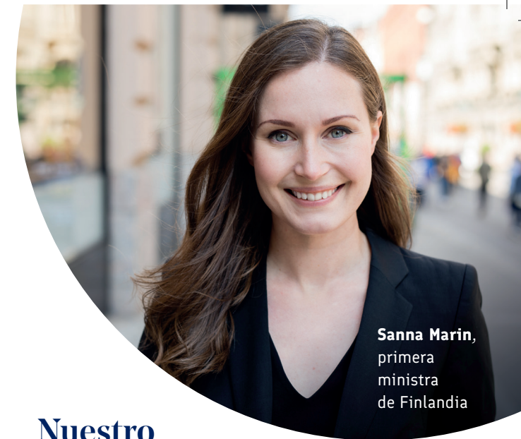
Sanna Marin, primera ministra de Finlandia

Para más información sobre nuestros compromisos y garantías, visite la página: um.fi/HRC , #FIforHRC