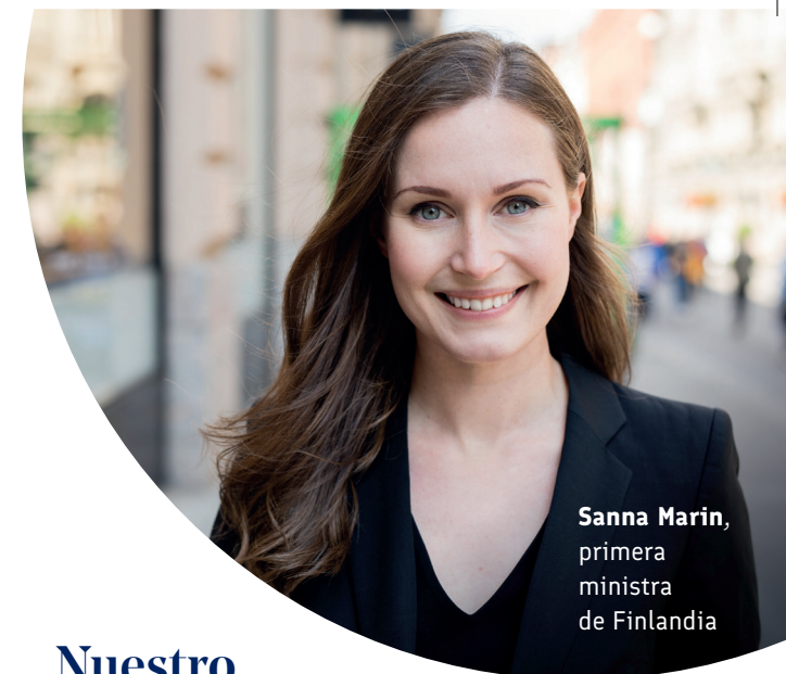
Sanna Marin, primera ministra de Finlandia

Para más información sobre nuestros compromisos y garantías, visite la página: um.fi/HRC , #FIforHRC