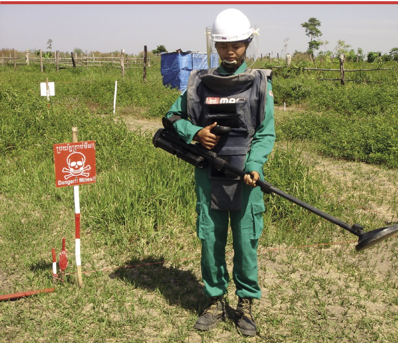
Suomi tukee humanitaarista miinatoimintaa maissa, jotka kärsivät vaikeasta miinaongelmasta. Kuvassa naispuolinen miinanraivaaja Kambodžassa.

Vuoden 2005 YK:n huippukokouksen loppuasiakirjaan kirjattiin ns. suojeluvastuun periaate 20 . Se rajattiin koskemaan joukkotuhoa, ihmisyyteen kohdistuvia rikoksia, sotarikoksia ja etnistä puhdistusta. Mikäli valtio on kyvytön tai haluton edellä mainittujen rikosten torjumiseen, voi kansainvälinen yhteisö viimeisenä kei-