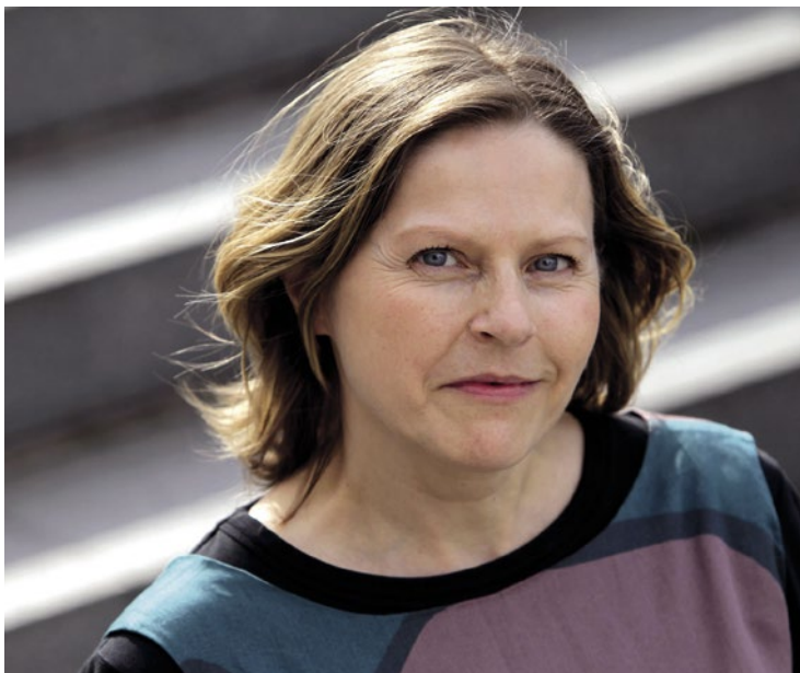
▲ Kehitysministeri Heidi Hautala

Ihmisoikeudet ovat luovuttamattomia myös konfliktien ja kriisien aikana. Suomi suuntaa humanitaarista apua sinne, missä avuntarve ja hätä ovat suurimmat, lähtökohtana humanitaariset periaatteet ja luotettavat tarvearviointit. Jotta apu saataisiin tehokkaasti perille, on YK-johtoisen kansainvälisen humanitaarisen avun järjestelmän oltava hyvin ennalta varautunut ja koordinoitu. Avun tuloksellisuutta on parannettu vuodesta 2005 lähtien humanitaarisen avun uudistusprosessilla. Suomi on voimakkaasti tukenut reformia ja toimii sen hyväksi jatkossakin. Tulevaisuudessa on entistä enemmän kiinnitettävä huomiota hyvään johtamiseen, kumppanuuksien laatuun, vaikutuksen arviointiin ja tilivelvollisuuteen. Näitä teemoja Suomi ajaa eteenpäin entistä aktiivisemmän politiikkavuoropuhelun ja avustusjärjestöjen johtokuntavaihtamisen kautta.