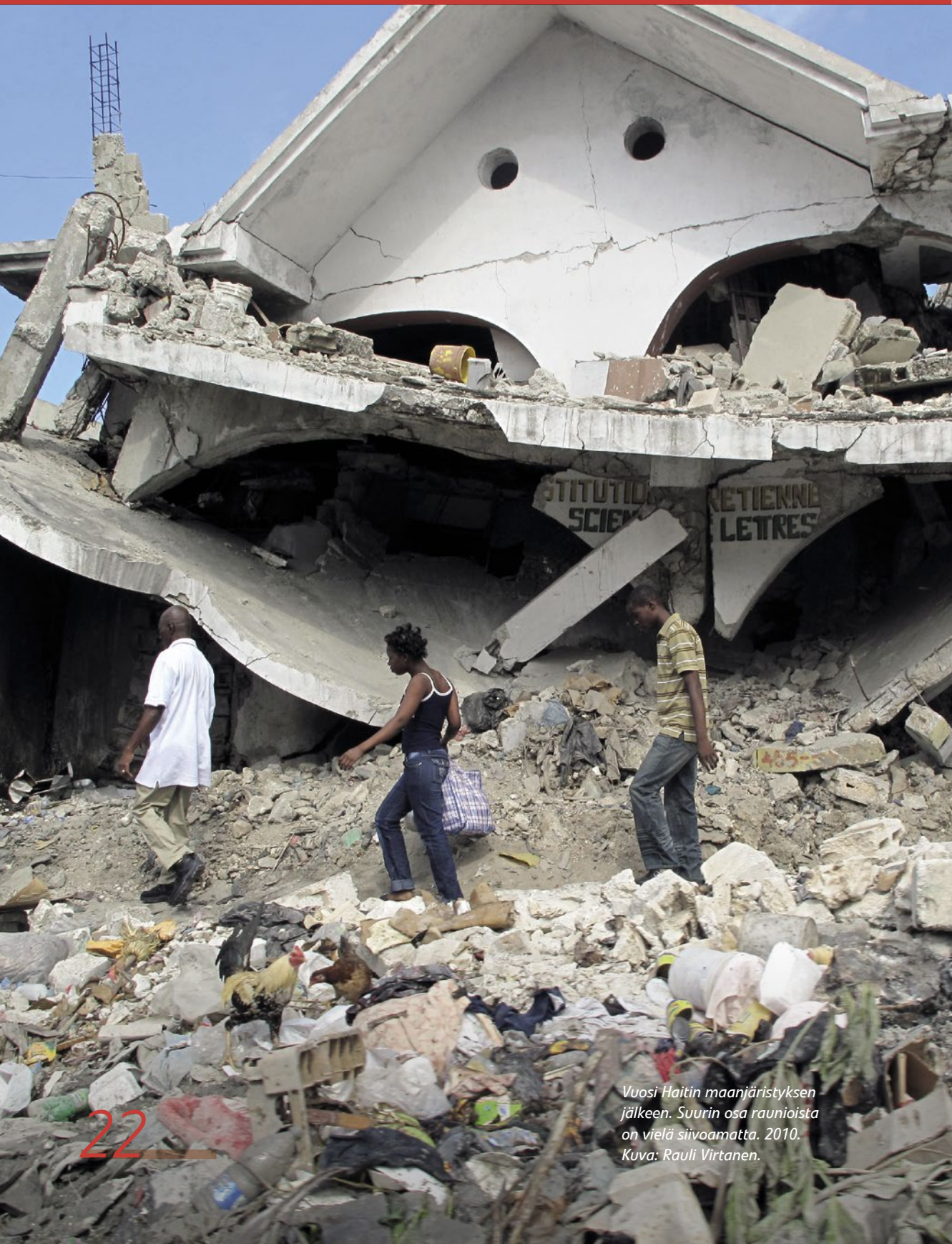
Vuosi Haitin maanjäristyksen jälkeen. Suurin osa raunioista on vielä siivoamatta. 2010.