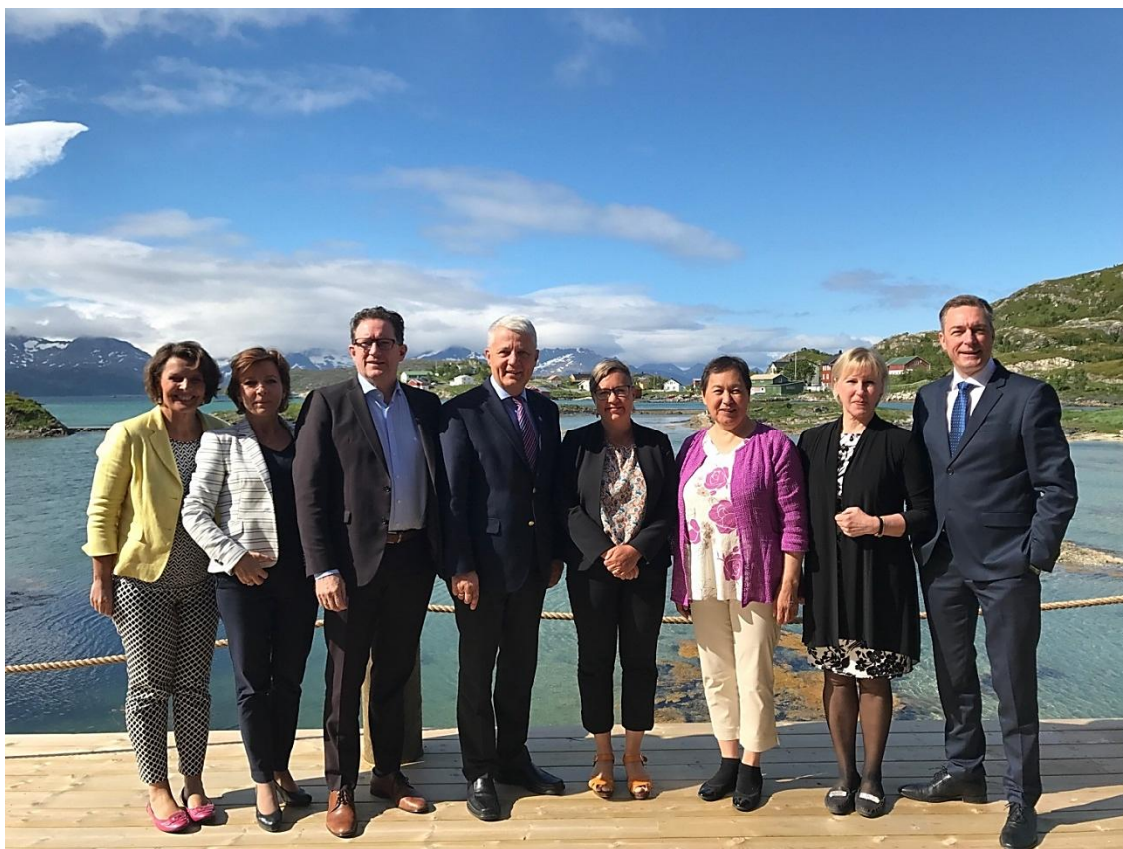
De nordiska samarbetsministrarna i Tromsø i juni.

Under mötena valde Norge hålla temadiskussioner som gällde de prioriterade områdena i ordförandeskapet. Ministrarna fortsatte Nordiska ministerrådets arbete med EU-frågor och startade en utredning för att utveckla de nordiska riskfinansieringsmekanismerna för småföretag som är i tillväxtfasen.