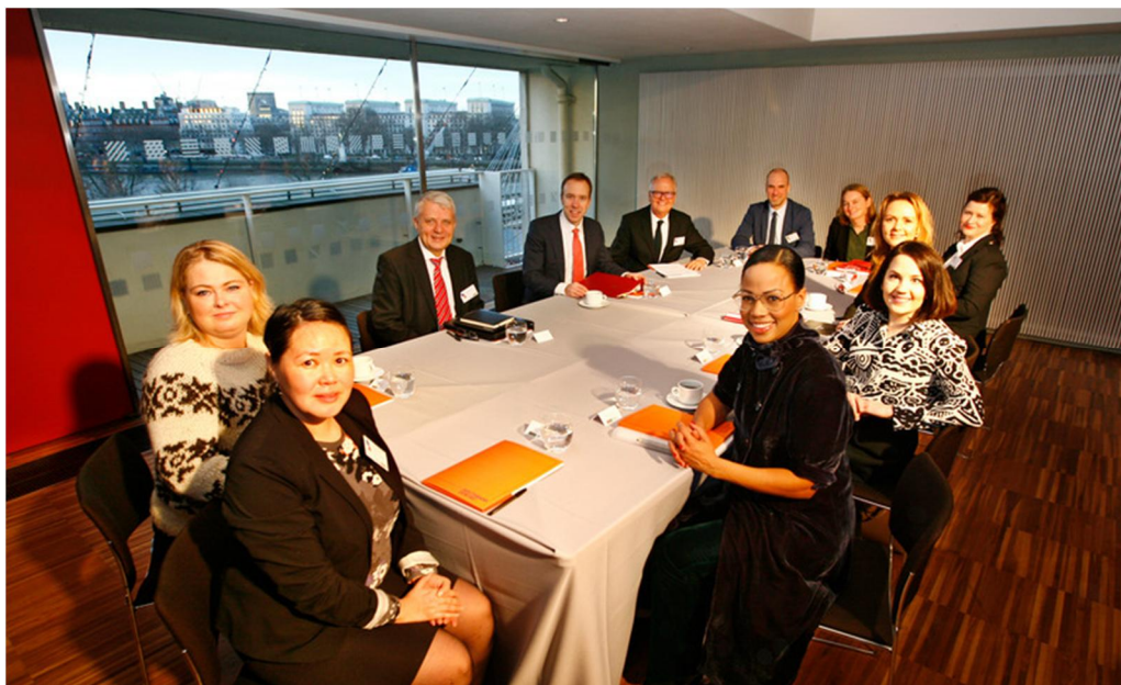
Kulturministrarna i London.

Genomförandet av temaåret byggde på ett brett samarbete mellan Nordiska ministerrådet, Southbank Centre, de nordiska ambassaderna i London och de nordiska konstråden (från Finland Centret för konstfrämjande) samt många andra aktörer, till exempel Finlands Londoninstitut. Ministerrådets finansieringsandel av temaåret var 5 miljoner danska kronor (cirka 670 000 euro). Under året ordnades även kuratorbesök från Storbritannien till Finland och man lyckades väcka ett brett intresse för de nordiska länderna och den nordiska kulturen i större skala i Storbritannien.