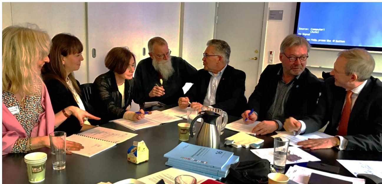
Gränshinderrådet 2017