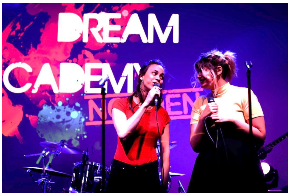
Musikgymnasister från Finland, Sverige och Norge deltog i Svenska nu:s musikprojekt Dream Academy Norden.

Nätverket Svenska nu firade sitt 10-årsjubileum 2017. Under året deltog mer än 80 000 elever och lärare i nätverkets verksamhet. Nätverket tillhandahöll program som spänner över olika läroämnen för elever i årskurserna 5–9, gymnasieelever samt i viss utsträckning för yrkesskolelever och högskolestuderande. År 2017 fördubblades antalet lärarkontakter jämfört med året innan, mer än 3 300 lärare deltog i fortbildningsevenemangen och Svenska nu:s program.