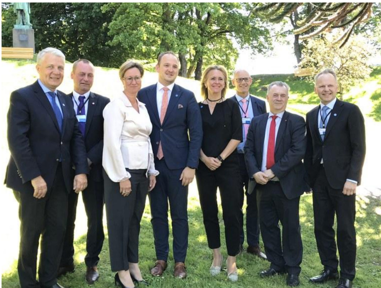
Jordbrukssektorns ministrar i Ålesund.

Ämbetsmannakommittén sammanträdde i mars och november. Vid mötena behandlades bland annat fortsättningen på PPP-samarbetet gällande pre-förädling av växter för 2018–2020. Man kom överens om att fortsätta samarbetet vid ministermötet i juni. Hela året diskuterades NordGens svåra finansieringssituation samtidigt som man försökte hitta lösningar för denna. Ämbetsmannagruppen besökte också NordGen i slutet av 2017.