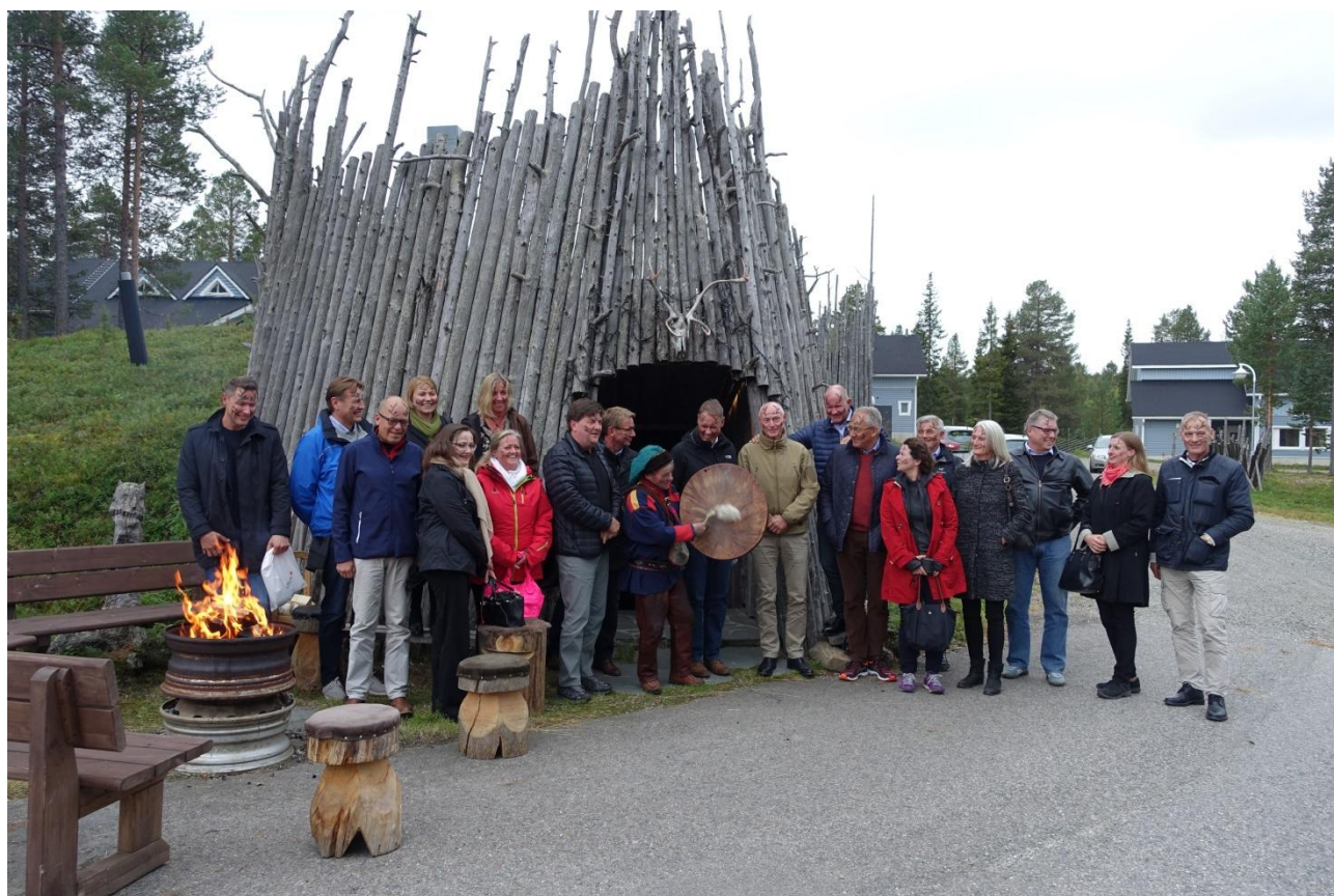
De nordiska polischeferna träffades i Levi.