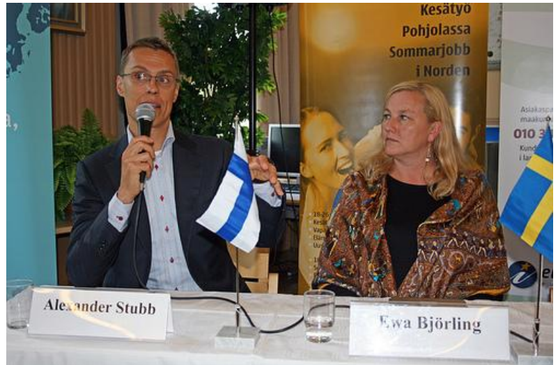
Pohjoismaisesta yhteistyöstä vastaavat ministerit Vaasan lyseossa syyskuussa 2011.

Pohjoismaisen yhteistyön sihteeristö toteutti yhteistyössä ulkoasianministeriön Eurooppa-tiedotuksen kanssa ns. road shown, jonka puitteissa kierrettiin puolen tusinaa suomalaista paikkakuntaa (Vuokatti, Joensuu, Hämeenlinna, Vaasa, Turku, Jyväskylä) pääasiassa erilaisissa oppilaitoksissa kertomassa pohjoismaisesta yhteistyöstä ja sen nuorille tarjoamista mahdollisuuksista tiettyjen teemojen avulla.