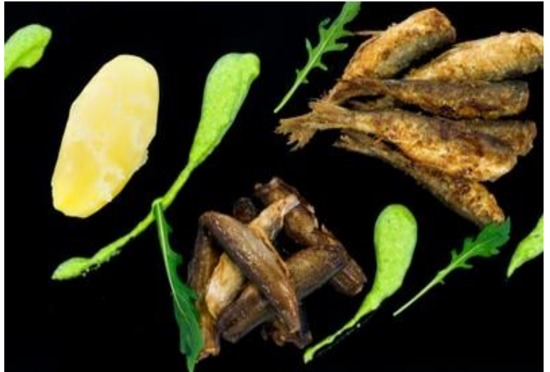
Uusi pohjoismainen ruoka on parhaimmillaan puhdasta, tuoretta, maukasta, mutkattomasti valmistettua sekä raaka-aineiltaan vuodenaikojen kiertoa kunnioittavaa ja lähellä tuotettua.