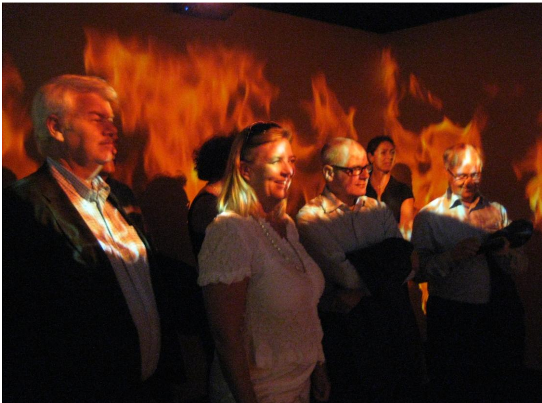
Pohjoismaiset pelastusylijohtajat Tuli on irti - näyttelyssä Turussa

Suomi vastasi vuonna 2011 myös pohjoismaisen virastopäällikkökokouksen eli pelastusylijohtajakokouksen järjestämisestä. Kokous pidettiin Turussa kesäkuussa ja sen esityslistan suunnittelusta vastasi Helsingissä maaliskuussa järjestetty virkamieskokous.