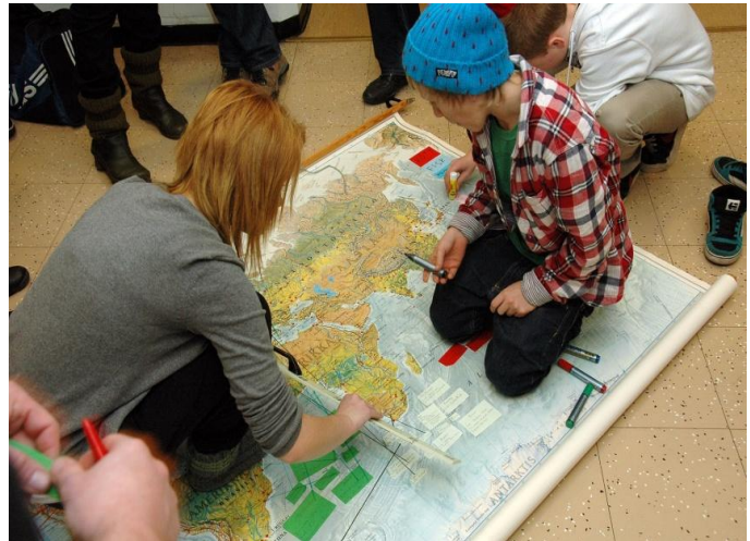
Ilmastopäivän viettoä Källhagenin koulussa Lohjalla.

Pohjoismainen ilmastopäivä järjestettiin kolmatta kertaa 11.11. Päivän teemana oli ruuan kulutuksen ja tuotannon vaikutukset ilmastonmuutokseen. Osana Suomen puheenjohtajuusvuotta järjestettiin Helsingissä myös asiantuntija-seminaari ilmastonmuutoksen opetuksesta Pohjoismaissa. Seminaarissa opettajat, tutkijat ja viranomaiset keskustelivat ilmastonmuutoksen pedagogiikasta, kuulivat uusinta tutkimustietoa sekä inspiroivia projektiesimerkkejä eri maista. Ilmastonmuutoksen käsittely laajeni kuluneena vuonna myös korkeakoulusektorille Aalto-yliopistolla järjestetyn Pohjoismaisen ilmastofestivaalin myötä.