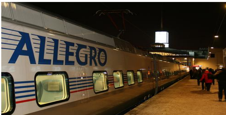
Yhteistyöministerit matkasivat Pietariin helmikuussa 2011 uudella Allegro-junalla.

Suomen lanseeraaman käytännön mukaisesti yhteistyöministerikokouksissa syvennyttiin varsinaisen kokousagendan lisäksi myös tiettyyn eritysteemaan ja käytiin tutustumassa kokouspaikkakuntien pohjoismaisiin toimijoihin. Pietarissa pureuduttiin lähialueyhteistyöhön ja erityisesti Luoteis-Venäjään, Vaasassa puolestaan rajaesteproblematiikkaan.