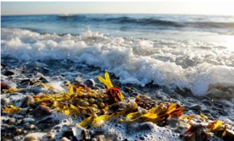
Toimet Itämeren suojelun vahvistamiseksi ovat olennainen osa pohjoismaista kestävän kehityksen työtä.

Pohjoismainen kestävän kehityksen konferenssi oli osa pohjoismaista konferenssiiperinnettä, jossa pohjoismaiset kaupungit järjestävät erityisesti alue- ja paikallistason toimijoille suunnattuja konkreettisiin käytäntöihin fokuoituja tilaisuuksia. Seuraava konferenssi järjestetään Ruotsin pohjoismaisen puheenjohtajuuskauden aikana 2013 Uumajassa.