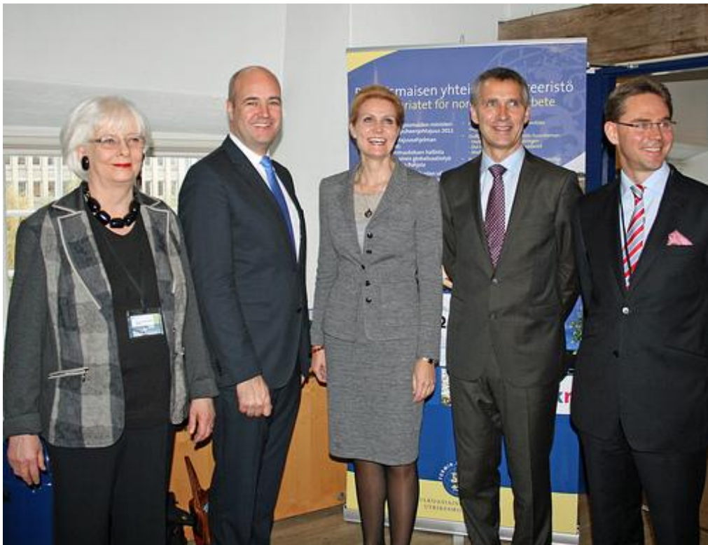
Pohjoismaiden pääministerit Pohjoismaiden neuvoston istunnon yhteydessä Kööpenhaminassa syksyllä 2011

Pohjoismaiden neuvoston Suomen valtuuskunnalle