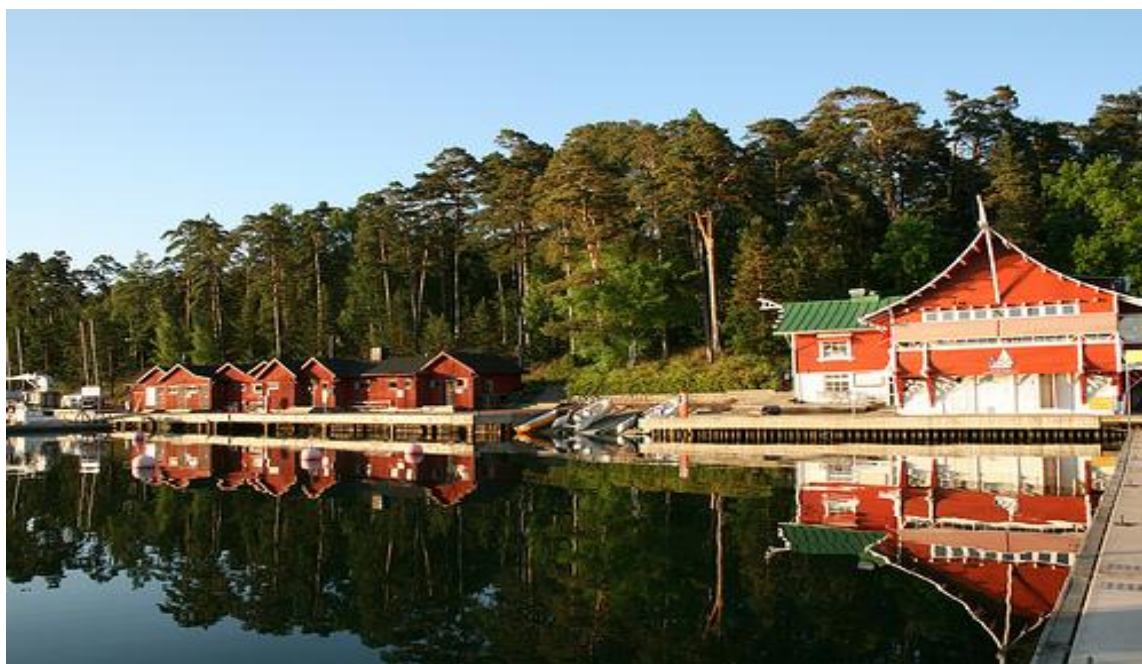
Pohjoismainen yhteistyökomitea NSK järjesti kokouksensa kesäkuussa 2011 Ahvenanmaalla

peruskirjauudistuksen myötä mitä tulee itsehallintoalueiden osallistumiseen talojen/instituuttien hallitustyöskentelyyn.