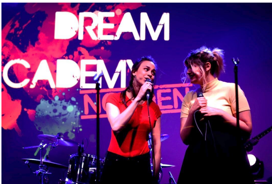
Musiikkilukiolaisia Suomesta, Ruotsista ja Norjasta osallistui Svenska nu:n Dream Academy Norden -musiikkiprojektiin.

Svenska nu -verkosto vietti 10-vuotisjuhlavuottaan vuonna 2017. Vuoden mittaan yli 80 000 oppilasta ja opettajaa osallistui verkoston toimintaan. Verkosto tarjosi eri oppiaineita ylittäviä ohjelmiaan 5.–9. vuosikurskien oppilaille, lukiolaisille sekä jossakin määrin ammattikoululaisille ja korkeakouluopiskelijoille. Vuonna 2017 opettajakontaktien määrä kaksinkertaistui edellisvuoteen verrattuna: täydennyskoulutustilaisuuksiin ja Svenska nu:n ohjelmiin osallistui yli 3300 opettajaa.