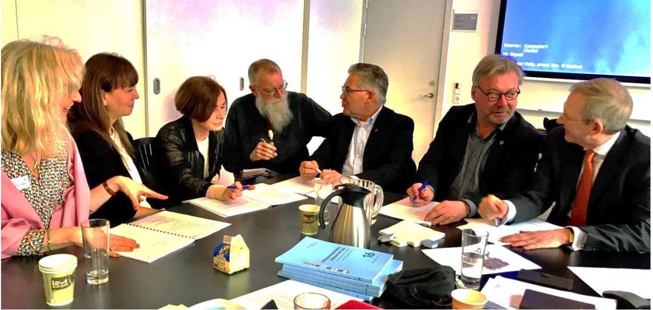
Rajaesteneuvosto 2017