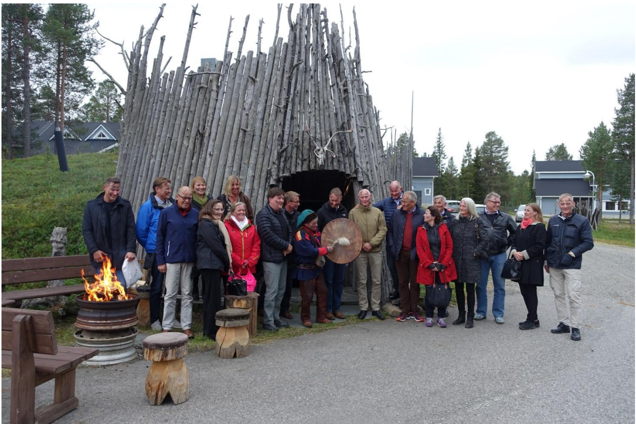
Pohjoismaiset poliisipäälliköt tapasivat Levillä.

Suomi toimi pohjoismaisen poliisiyhteistyön puheenjohtajana 2017. Yhteistyö on muodoltaan välitöntä ja tuloksekasta ja yhteistyön perustana on pohjoismainen yhteenkuuluvaisuus ja tasa-arvoisuus. Yhteistyö perustuu ylijohdajien strategisessa valvonnassa tapahtuvaan eri poliisialojen alatyöryhmien ja verkostojen