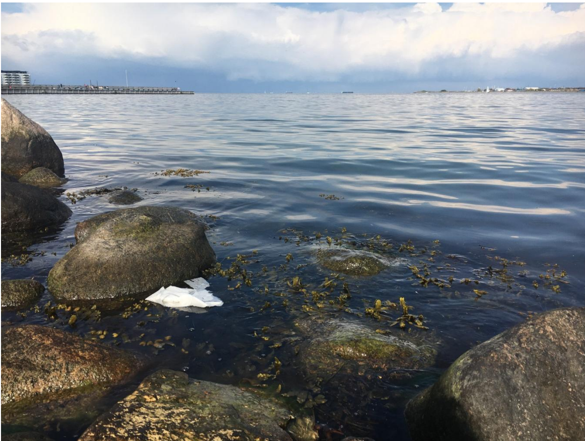
Muovia meressä.

Vuonna 2017 muovien kertyminen meriin ja ympäristöön oli edelleen vahvasti esillä, ja ministerit hyväksyivät toukokuussa PMN:n ympäristösektorin muovistrategian, jota toimenpanevat sektorin työryhmät ja virkamieskomitea. Ministerit lähettivät kesällä komissiolle kirjeen, jossa toivat esille Pohjoismaiden näkemyksensä komission tulevasta muovistrategiasta (Strategia julkistettiin tammikuussa 2018). Kirjeessä esitettyjä näkökohtia olikin otettu huomioon mm. komission julkisessa kuulemisessa.