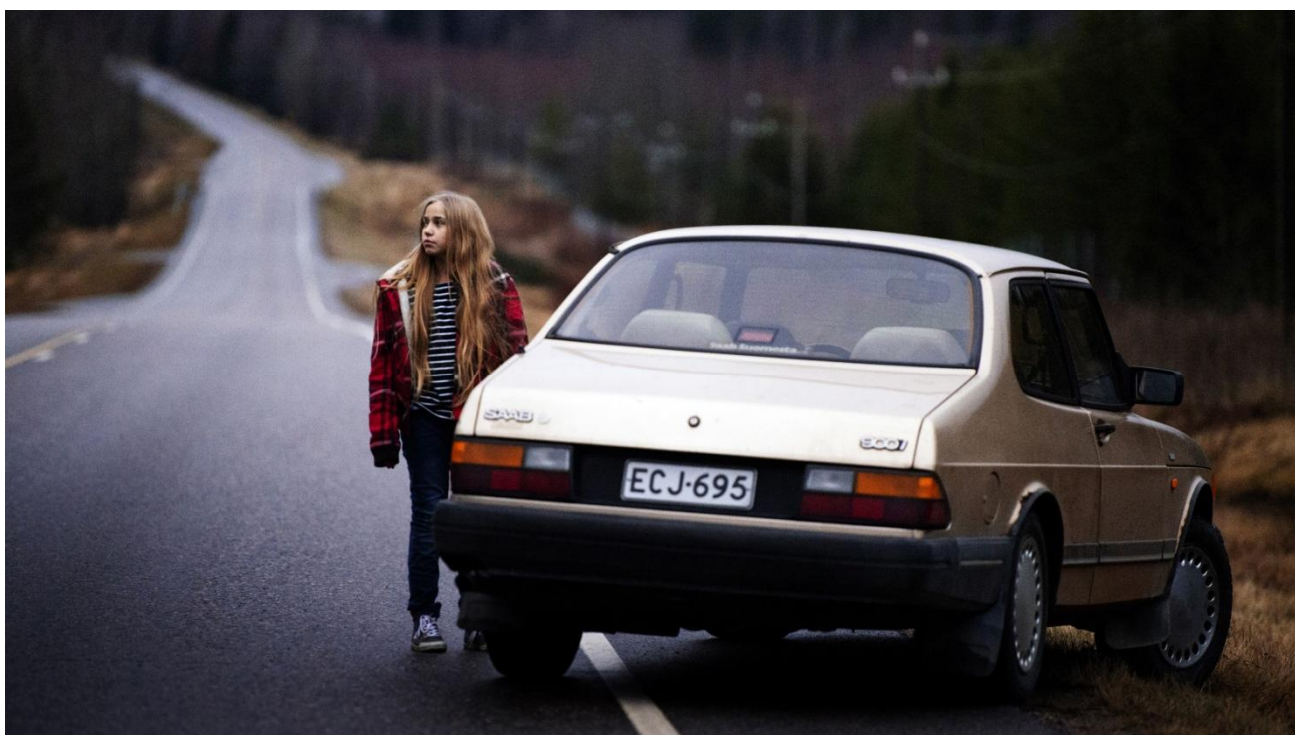
PN:n elokuvapalkinnon sai suomalainen elokuva "Tyttö nimeltä Varpu".