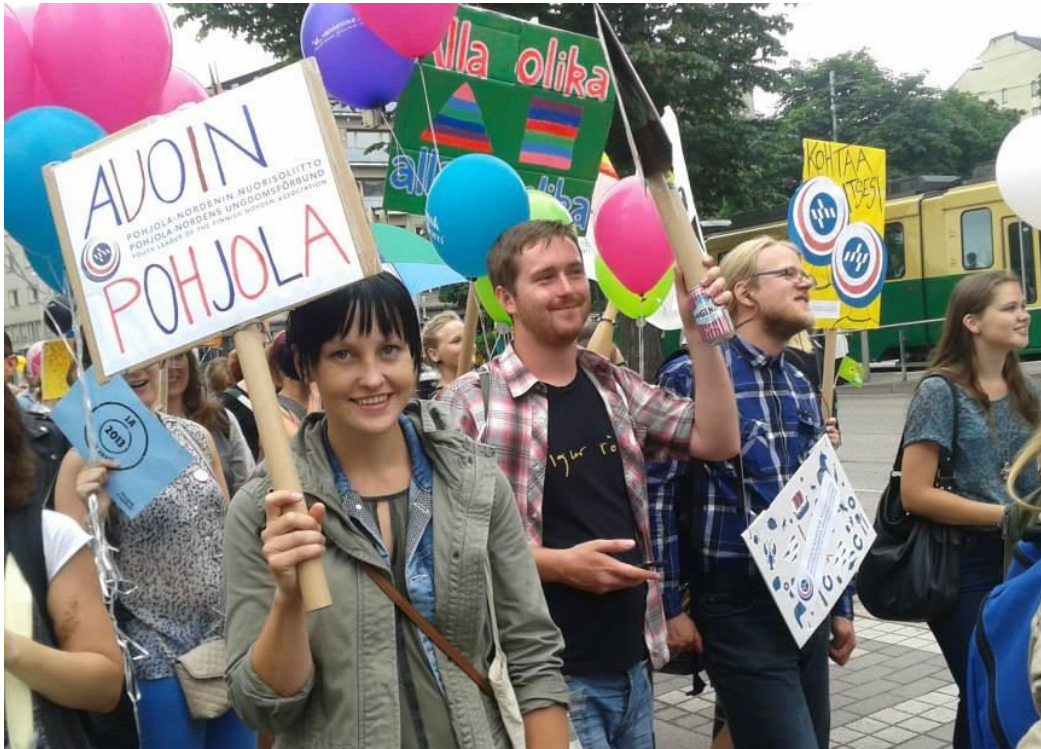
PNN marssii avoimen Pohjolan puolesta Helsinki Pride -kulkueessa 29.6.2013

maisen korkeakoulujen yhteishaun sekä ruotsin opetuksen puolesta. Strategian mukainen painopistealue vuoden 2013 toiminnassa oli yhteistyö Nuorisoliiton pohjoismaisten sisarjärjestöjen kanssa.