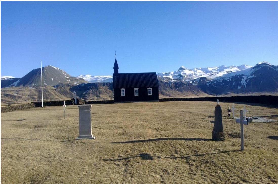
Poliisijohtajat kokoontuivat 6.-8.5.2013 Búðirissa, Islannissa. Kuvassa Búðakirkja, Vesturland, Islanti

Poliisiyhteistyössä sovittiin laajaksi paisuneen työryhmäyhteistyön tiivistämisestä ja keskittymisestä vain pohjoismaista lisäarvoa tuottaviin asioihin. Työryhmiä karsittiin ja laadittiin selkeät suuntaviivat ja säännöt miten niiden toiminnasta raportoidaan poliisiylijohtajille.