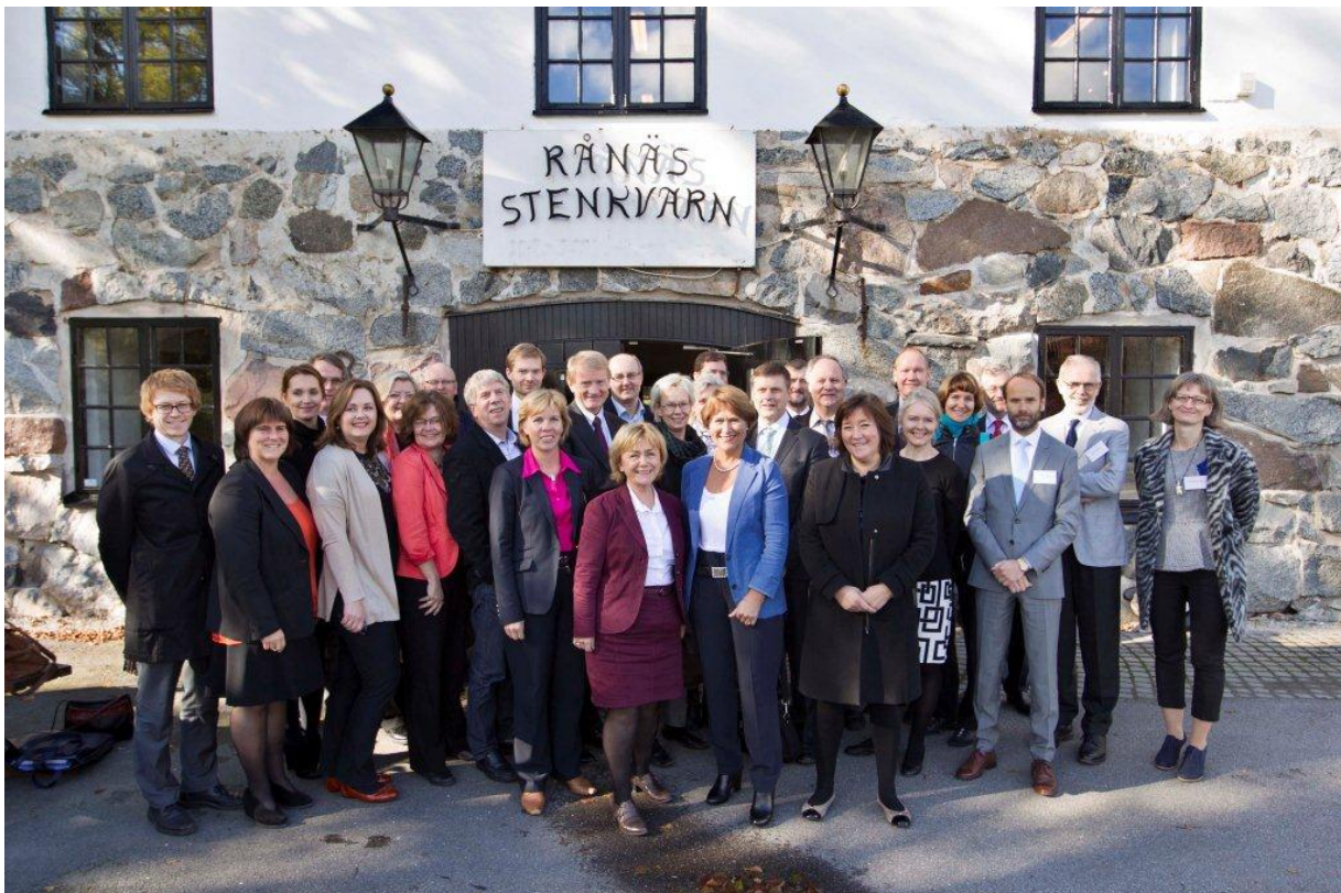
Pohjoismaainen oikeusministerikokous pidettiin Rånäsissa Norrtäljessä syys-lokakuun vaihteessa.

Pohjoismaista yhteistyötä täydentää Pohjoismaiden ja Baltian maiden Nordic-Baltic-yhteistyö. Sen tavoitteena on syventää yhteistyötä sekä parantaa koordinoitua ja tiedonvaihtoa. Latvia järjesti riitojen sovittelua koskevan seminaarin ja Viro seminaarin pikaluottoihin liittyvistä ongelmista syksyllä 2013. Seuraava Pohjoismaiden ja Baltian maiden oikeusministerikokous pidetään Tanskassa 2014.