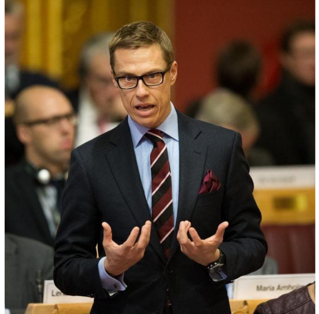
Ministeri Stubb PN:n istunnossa Osllossa lokakuussa

Ministerineuvoston naapuruusyhteistyön saralla hyväksyttiin uudet suuntaviivat Baltian maiden, Luoteis-Venäjän sekä Valko-Venäjän kanssa tehtävälle yhteistyölle ja käytännön yhteistyö jatkui aktiivisena. Vuoden