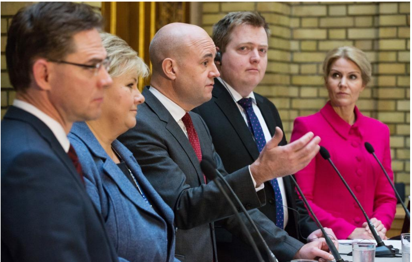
Pohjoismaiden pääministerit Oslossa lokakuun lopussa.

Pohjoismaiden neuvoston istunnon yhteydessä pidetyissä keskusteluissa pääministerit keskittyivät arktiseen ja Barents-yhteistyöhön, ajankohtaisiin ulko- ja turvallisuuspoliittisiin aiheisiin (mukaan lukien joulukuun Eurooppa-neuvoston agenda) sekä Yhdysvaltain presidentti Obaman ja Pohjoismaiden päämiesten tapaamisessa Tukholmassa syyskuussa sovitun julkilausuman seurantaan. Lisäksi keskusteltiin kasvun ja kilpailukyvyn edistämistä, pääministerien aloitteesta terveysyhteistyön lisäämisestä sekä rajaesteyhteistyöstä. Pääministerit hyväksyivät istunnon yhteydessä julistuksen rajaesteiden poistamisesta Pohjolassa: "Pohjola rajattoman yhteistyön edelläkävijänä tavoitteena työpaikkojen ja kasvun luominen".