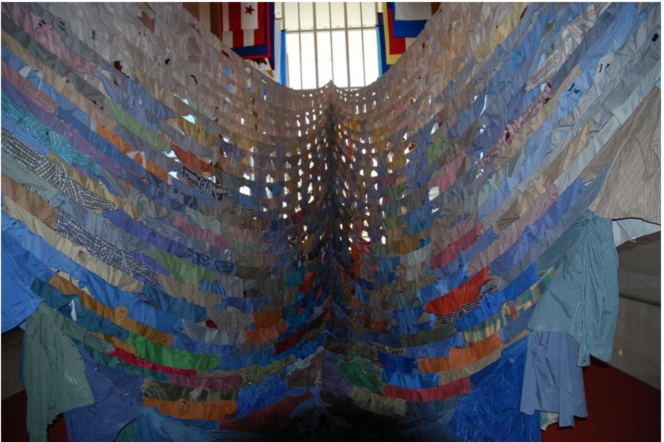
Kaarina Kaikkosen installaatio "Are we still afloat" Kennedy Centerin sisääntuloaulassa

Suomi tuki suomalaisia esiintyjä suoraan ja osallistui tällä tavoin kulttuurisatsauksen kustannuksiin.