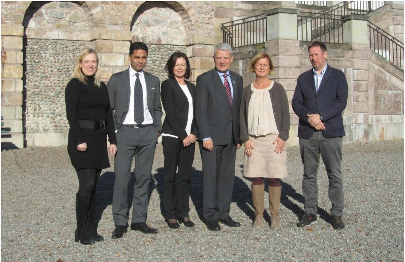
Pääsihteeri Høybråten ja pohjoismaiset tasa-arvoministerit YK:n naisten asema -toimikunnan istunnossa New Yorkissa maaliskuussa 2013.